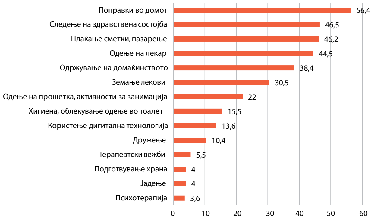
Графикон: Удел на стари лица кои изразиле потреба од поддршка во вршењето на активностите, според видот на активност, %