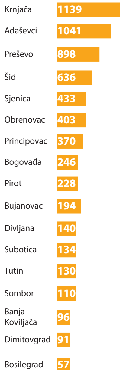
Popunjenost centara za azil i prihvatnih i tranzitnih centara, 25. januara 2017. godine